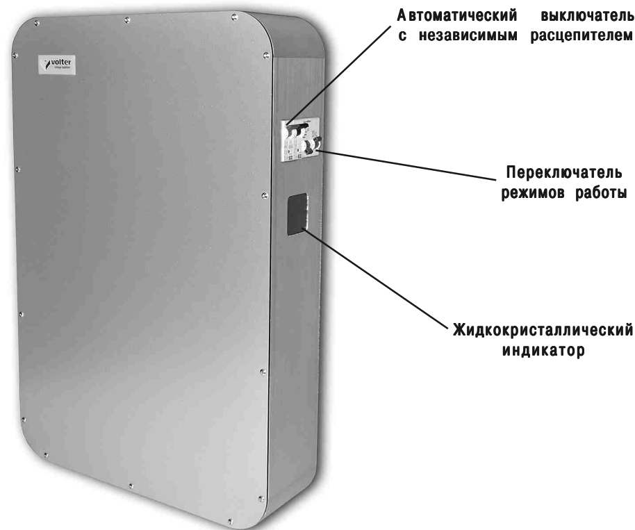
Рис. 1. Стабилизатор напряжения

В верхней части расположен клеммник, для подключения стабилизатора, закрытый крышкой. Там же расположен заземляющий контакт.